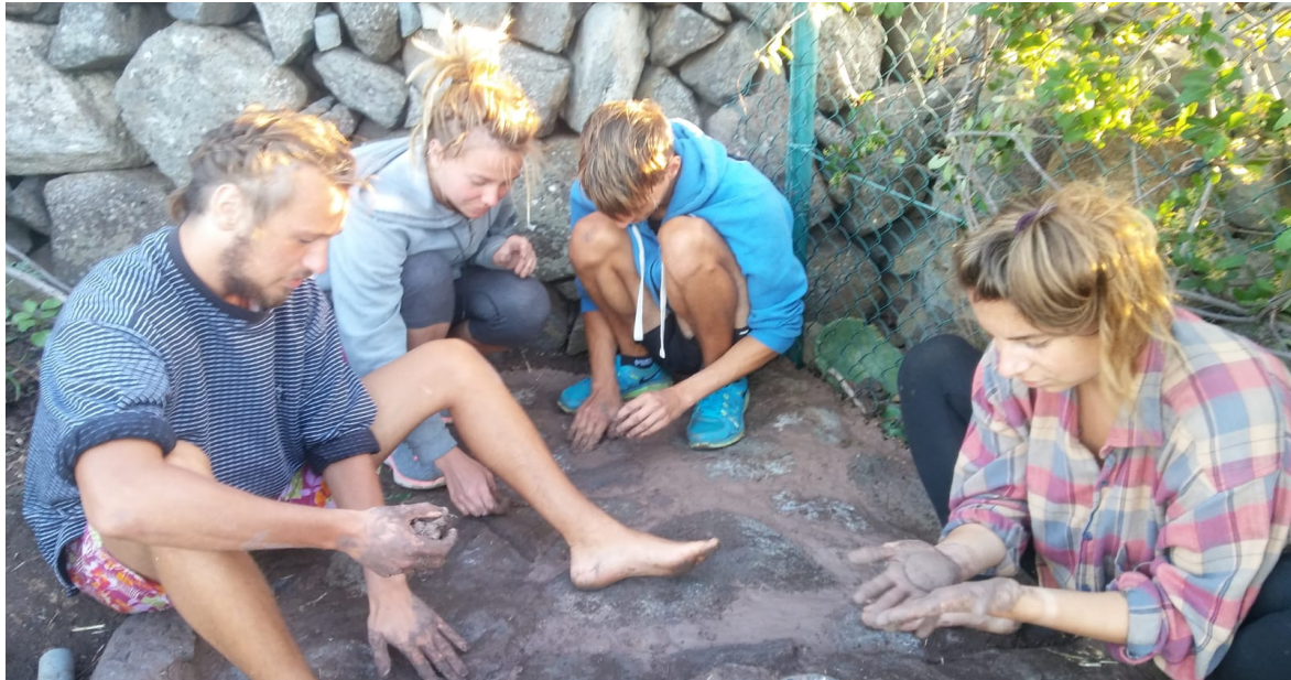
Dry toilet alapzatának készítése vályogból és kövekből