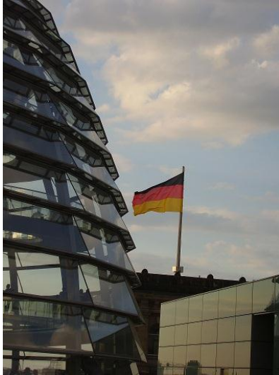
Reichstag - Parlament

Harmadéves kertészmérnök hallgató vagyok a Corvinus Egyetem Kertészettudományi karán. Ebben a beszámolóban elmesélem miként is jött az ötlet, a lehetőség, hogy a szakmai gyakorlatomat Berlinben töltssem és milyen tapasztalatokat szereztem ezzel kapcsolatban.